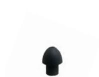
p. 510 / PSF1010-4