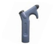
p. 510 / PSF